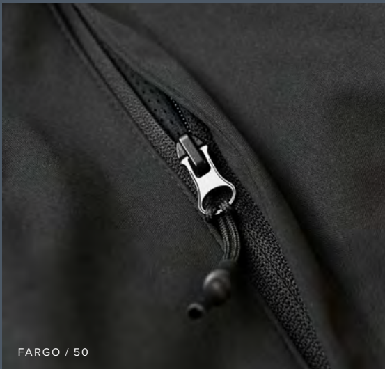
FARGO / 50