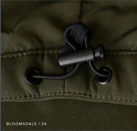
BLOOMSDALE / 34