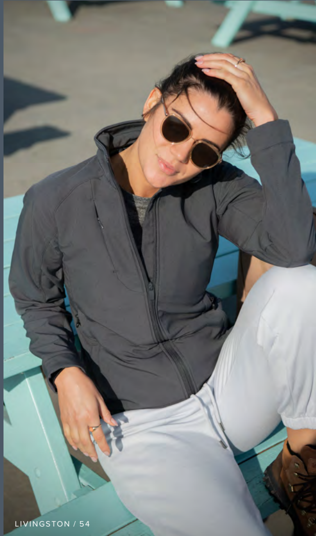
LIVINGSTON / 54